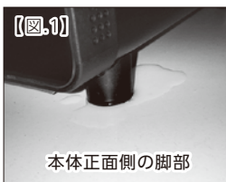
本体正面側の脚部